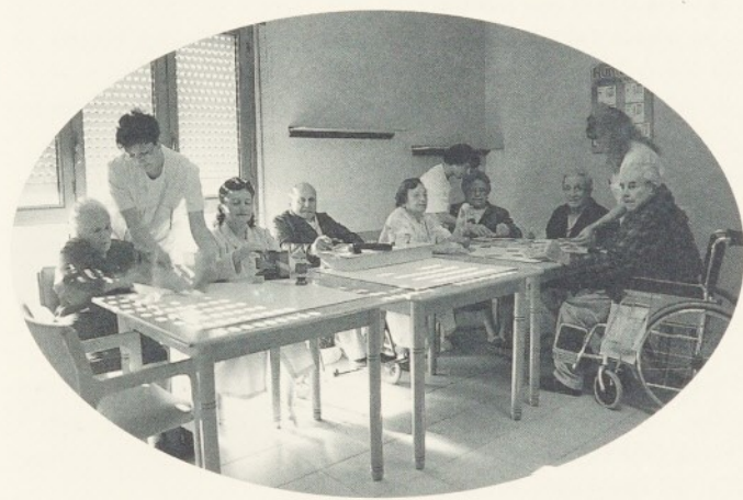
Sala d'estar de Convalescència.

L'any 1986 es va crear el Programa Vida als Anys (PVA). Aquest programa es va iniciar al Departament de Sanitat i Seguretat Social i es finançava mitjançant l'aportació de l'Institut Català de la Salut (ICS) i l'Institut Català d'Assistència i Serveis Socials (ICASS).