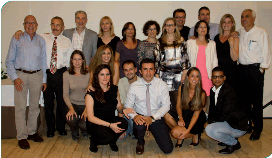
L'equip de professionals del Servei d'Anestesiologia i Reanimació de l'Hospital General de Granollers

Aquest mes d'octubre fa 35 anys que es va posar en funcionament el Servei d'Anestesiologia i Reanimació de l'Hospital General de Granollers. Per aquest motiu, els professionals del servei van organitzar un sopar homenatge per poder commemorar aquesta data tan especial, en el que es va reunir a bona part dels professionals que han passat pel servei durant tots aquests anys.