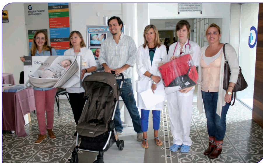
Els fotògrafs premiats al Concurs, amb els seus premis

La Comissió de Lactància de l'Hospital General de Granollers, amb la col·laboració de l'empresa