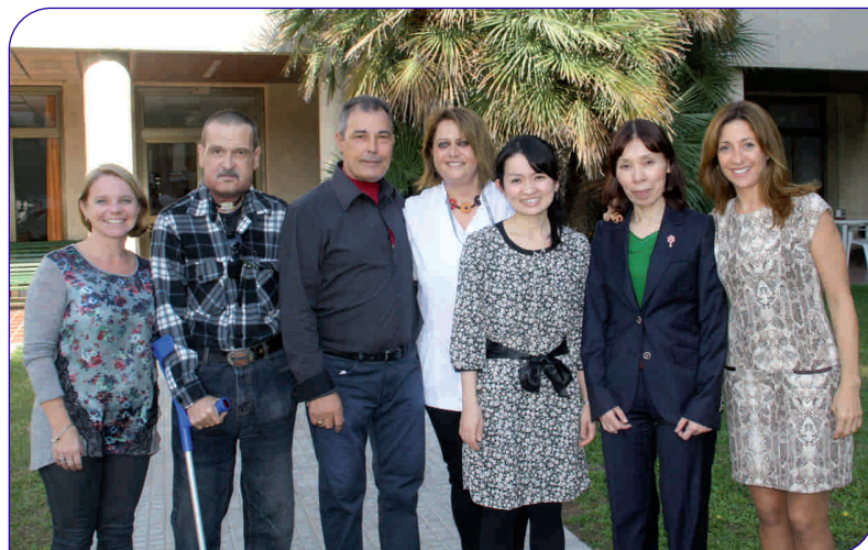
Les dues logopedes japoneses van ser a l'Hospital General de Granollers al mes d'octubre de l'any passat

El passat mes d'octubre la Fundació Privada Hospital Asil de Granollers va rebre la visita de dues professionals logopedes del Japó que treballen amb pacients a qui s'ha practicat una laringectomia.