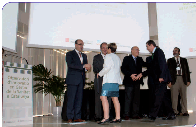
Els representants de l'Hospital General de Granollers van rebre els premis en presència del conseller Boi Ruiz

En el marc de la II Jornada de l'Observatori d'Innovació en Gestió de la Sanitat a Catalunya (OIGS), celebrada el mes d'octubre a Barcelona, el Nou model d'atenció integral de la Lumbàlgia al Vallès Oriental i el Programa d'atenció al pacient pluripatològic a medicina interna de la Fundació Privada Hospital Asil de Granollers van rebre, com a millors experiències, el certificat de qualitat del procés d'avaluació expedit per l'Agència de Qualitat i Avaluació Sanitàries de Catalunya (AQuAS) a mans del conseller de Salut, Boi Ruiz.