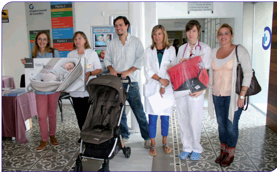
Els fotògrafs premiats al Concurs, amb els seus premis

La Comissió de Lactància de l'Hospital General de Granollers, amb la col·laboració de l'empresa