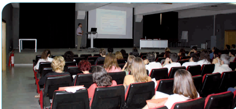
La II Jornada Neurològica va comptar també amb la participació de professionals dels hospitals de Sant Celoni i Mollet

També com a novetat, en aquesta ocasió la Jornada Neurològica va comptar amb la col·laboració de l'Hospital de Sant Celoni i dels neuròlegs de l'Hospital de Mollet del Vallès.