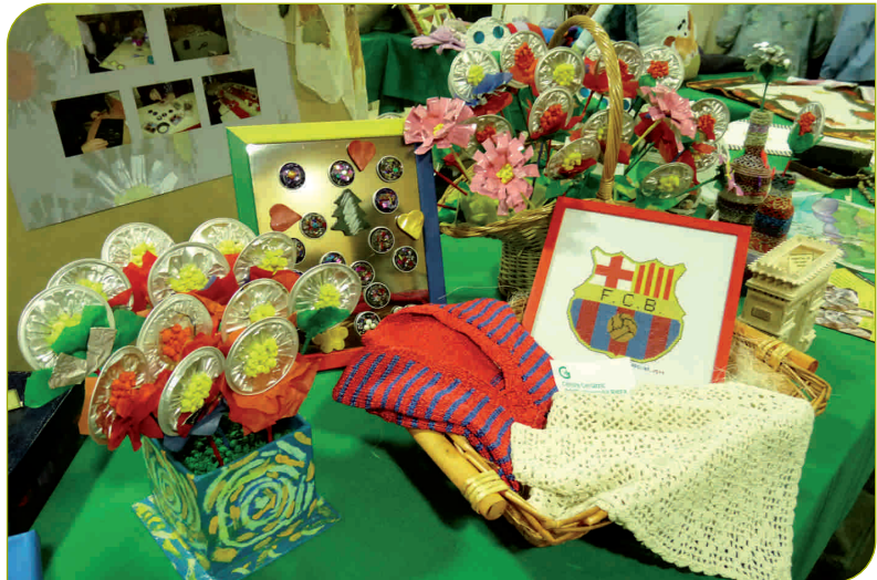
Algunes de les manualitats que es van exposar a la Sala Tarafa de Granollers

Durant les Jornades es va gaudir de l'exposició de treballs manuals realitzats pels ciutadans de Granollers a la Sala Tarafa fruit dels diversos tallers que es porten a terme a la ciutat. La participació de la Residència va ser nombrosa, amb mostres manuals de 22 residents; l'Hospital de Dia geriàtric va aportar-hi manualitats de 6 usuaris i l'Hospital de Dia Sant