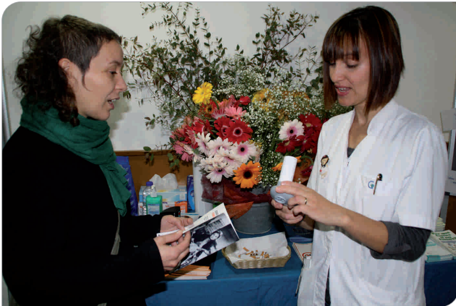
Els professionals de l'Hospital continuen treballant perquè professionals, pacients i visitants deixin el consum de tabac

L'Hospital General de Granollers forma part de la Xarxa Catalana d'Hospitals sense Fum des del 25 de setembre de 2005. Per aquest motiu i per ple convenciment de l'important rol exemplar que tenen els hospitals i centres sanitaris en el control del consum de tabac, l'Hospital treballa per assolir que sigui un veritable espai 100% Hospital lliure de fum.