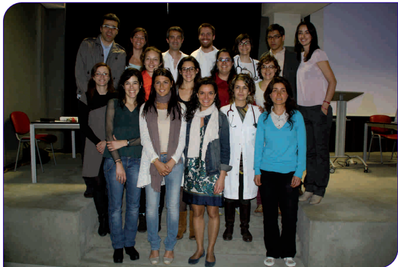
Alguns dels vint-i-quatre especialistes en formació que han acabat la seva estada a l'Hospital General de Granollers