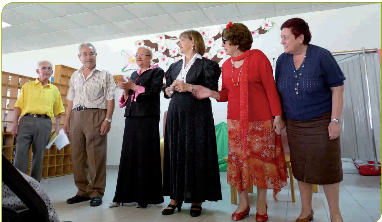
El grup de teatre Gregori va fer riure de valent les 140 persones que van assistir al seu espectacle de monòlegs al Centre Geriàtric Adolfo Montañá