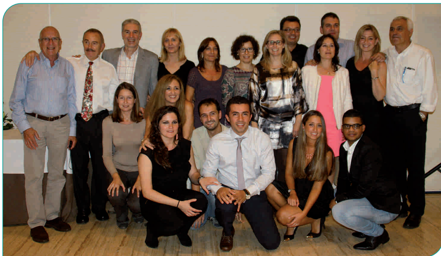
L'equip de professionals del Servei d'Anestesiologia i Reanimació de l'Hospital General de Granollers

Aquest mes d'octubre fa 35 anys que es va posar en funcionament el Servei d'Anestesiologia i Reanimació de l'Hospital General de Granollers. Per aquest motiu, els professionals del servei van organitzar un sopar homenatge per poder commemorar aquesta data tan especial, en el que es va reunir a bona part dels professionals que han passat pel servei durant tots aquests anys.