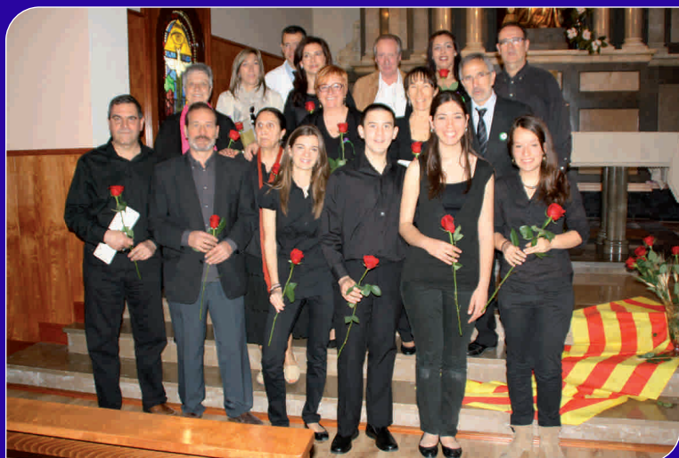
Un moment de la celebració de Sant Jordi de l'any passat a l'Hospital

Paral·lelament a aquestes activitats, el Banc de Sang va realitzar una marató de