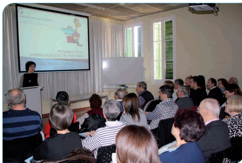
La malaltia de Parkinson és la segona malaltia neurodegenerativa en freqüència després de l'Alzheimer

Per tal de commemorar el Dia Mundial del Parkinson, la Fundació Privada Hospital Asil de Granollers conjuntament amb l'Associació Catalana per al Parkinson, van organitzar el mes d'abril de 2013 la Jornada "Malaltia del Parkinson: la importància de l'autocura" amb l'objectiu de donar a conèixer tota la informació relativa a aquesta malaltia, les seves teràpies i la