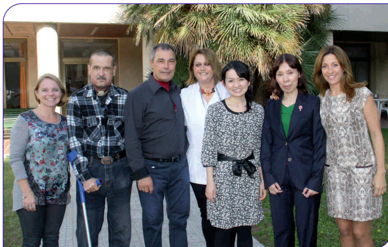
Les dues logopedes japoneses van ser a l'Hospital General de Granollers al mes d'octubre de l'any passat

El passat mes d'octubre la Fundació Privada Hospital Asil de Granollers va rebre la visita de dues professionals logopedes del Japó que treballen amb pacients a qui s'ha practicat una laringectomia.