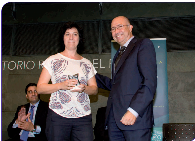
Aquest és l'onzè premi TOP 20 que es dona a la Fundació Privada Hospital Asil de Granollers des de l'any 2000

És una Unitat amb una gran implicació en la docència. Els seus professionals formen part dels equips docents de l'Hospital que donen formació tant a especialistes de postgrau (MIR) com a estudiants universitaris procedents de la Universitat Internacional de Catalunya (UIC).