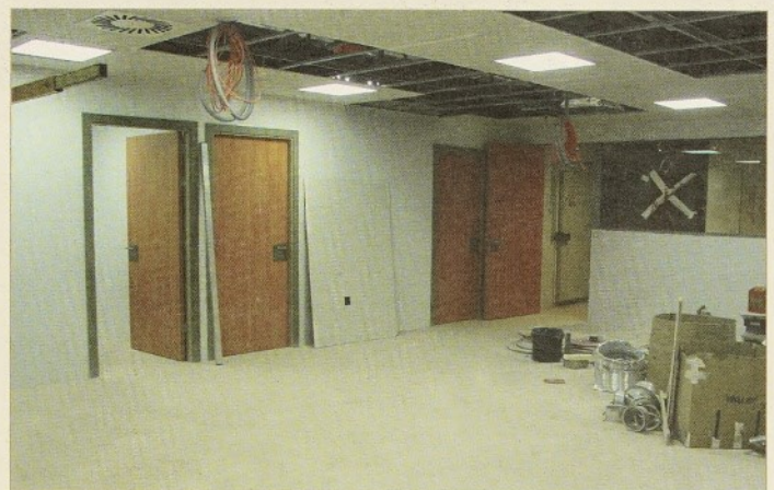
El nou laboratori agruparà bioquímica, microbiologia, hematologia, banc de sang i urgències

Laboratori clínic: tindrà una superfície de més de 500 m 2 i agruparà les àrees de bioquímica, microbiologia, hematologia, banc de sang i laboratori d'urgències. A diferència de com és ara, l'àrea d'extraccions no estarà situada al laboratori, sinó que s'instal·larà a la planta baixa de l'edifici històric, on actualment hi ha el servei de farmàcia. Aquesta ubicació en facilitarà l'accés al públic, ja que quedarà a pocs metres de l'entrada principal al nou edifici de consultes externes.