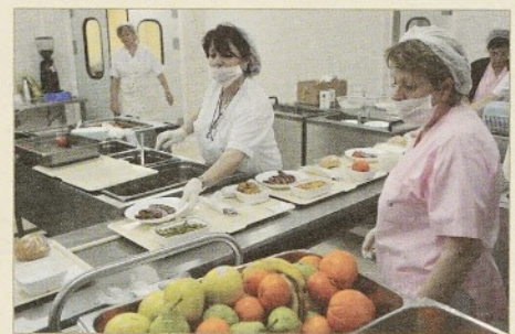
La cuina i el menjador del personal ja estan en servei

El soterrani -2 va quedar complet fa uns mesos amb la posada en funcionament dels vestidors, llenceria i magatzem general, que van unir-se a l'arxiu d'històries clíniques. Al soterrani -1 ja funciona des de principis d'any la cuina i el menjador del personal, i està previst que abans de l'estiu estiguin enllestides les dependències que han d'ocupar la farmàcia i el laboratori clínic. Amb això, els soterranis ja estaran del tot acabats.