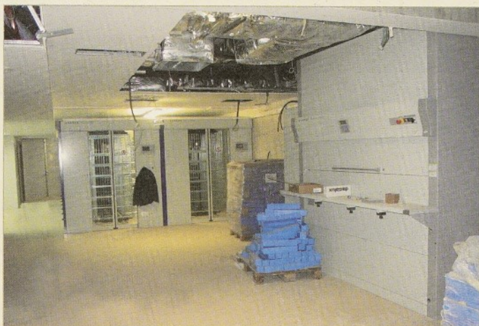
La farmàcia tindrà un sistema d'emmagatzematge automatitzat

Farmàcia: amb una superfície de més de 500 m 2 , agruparà totes les àrees: dispensació de medicaments al públic extern, preparació de medicació, centre d'informació de medicaments i dispensació i àrees administratives. A més, incorporarà millores en els sistemes de magatzem i distribució de medicaments amb un sistema d'emmagatzematge rotatori automatitzat per a la distribució de la medicació.