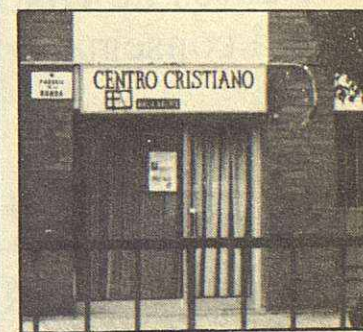
Les altres esglésies