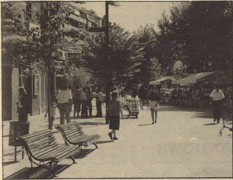
Mollet se convertirá en la ciudad con más habitantes de la comarca

Mollet del Vallès está viviendo un considerable aumento de población. El número de viviendas que se están construyendo confirman las previsiones realizadas hace unos años. Mollet ha de ponerse al día en numerosos sectores. Los cambios que vivirá Mollet obligan a que se construyan un nuevo ambulatorio, un parque de bomberos, así como dos nuevos colegios. Mollet está ante el reto de ser no solamente una ciudad, sino también en la capital de la subcomarca.