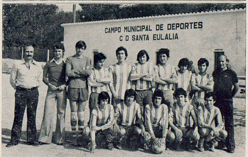
1. Una bella panoràmica que ja no podem tornar a veure del natural. El «Pont de Can Donat» ha estat enderrocat per construir-ne en el mateix lloc un de més ample, més valent i més modern. — 2. Un grup de nedadors i nedadores pertanyents al C. N. Santa Eulàlia. — 3. L'equip juvenil del C. D. Sta. Eulàlia, acompanyat del seu entrenador i cuidadors, que tan bona campanya ha fet en els campionats de la present temporada.