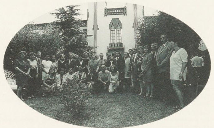
Els professionals que fa 25 anys o més que treballen a l'Hospital van rebre un homenatge molt especial.