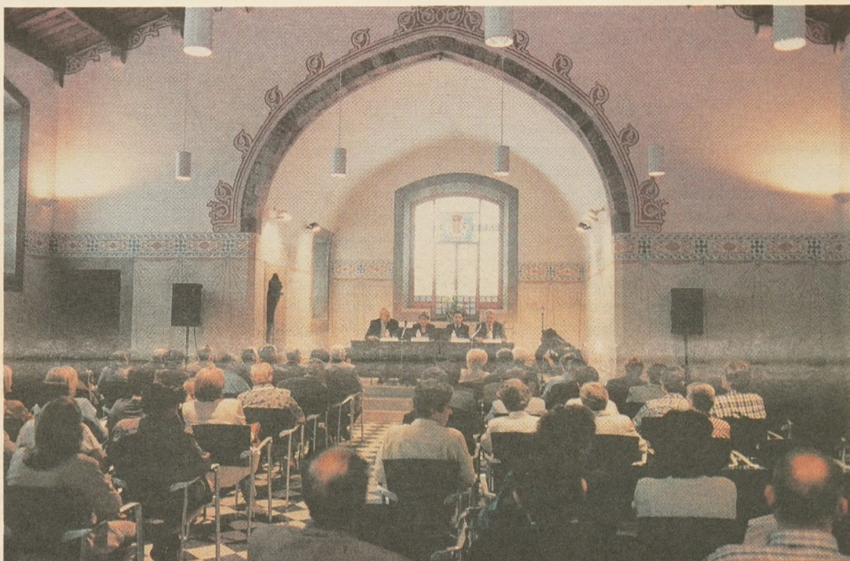
Acte de cloenda a la Sala Tarafa.