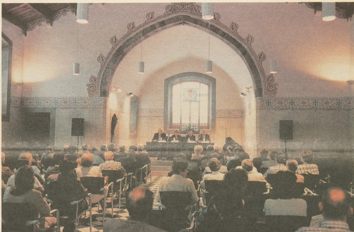
Acte de cloenda a la Sala Tarafa.