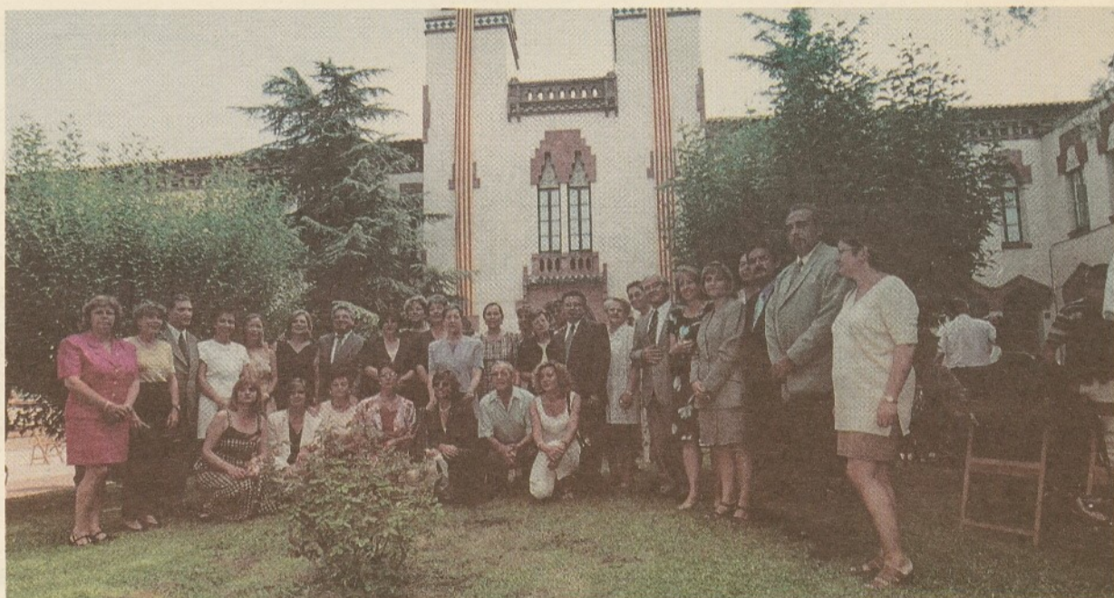
Els professionals homenajats pels seus 25 anys o més a l'Hospital.