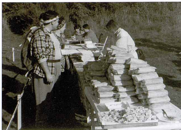
Avituallament a la marxa Matagalls-Granollers.