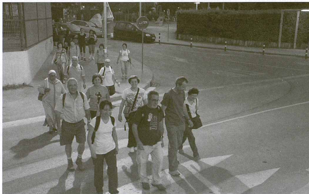
Els participants a punt de travessar el pont sobre el Congost, a l'inici de la Caminada.

L'itinerari, que començava a la plaça de l'Església, passava pel passeig fluvial en direcció sud, pel vessant dret del Congost, fins a l'alçada del barri del Junyent de Palou, on iniciava el retorn tot pujant a la dreta cap la serra de Ponent, ca l'Esquella, polígon del coll de la Manya i serra de Sant Nicolau, i baixant pel camí de l'Escanyat fins arribar a la plaça de les Hortes. En