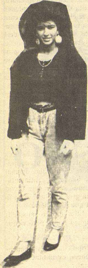
La joventut es bella y sana, ¡cuidémosla!

Ja ho diu la vella dita castellana: «juventud, divino tesoro». I és que en el període dels anys de joventut és quan a tots se'ns forjen els ideals, la forma de ser i d'actuar, i quan gaudim de la vida d'una forma especial. Ara, els joves de la dècada dels 80 tenen uns problemes específics, l'atur, la forma de divertir-se, entre d'altres.