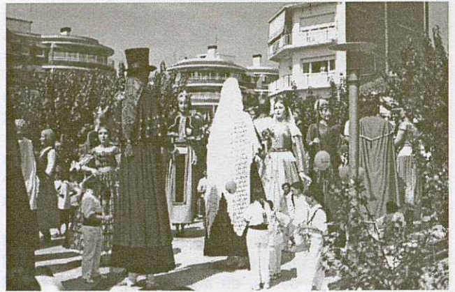
Gegants de moltes contrades ballaren pels nostres carrers.