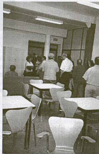
Una de les sales del nou Centre Cívic