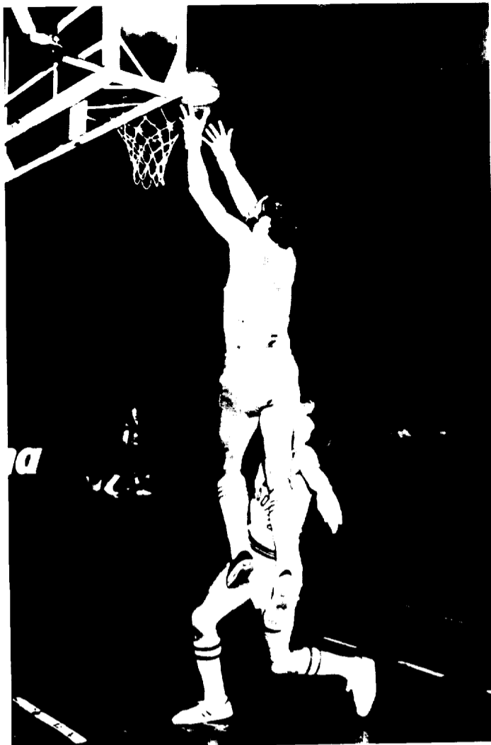
Puigventós que realizó un sensacional partido fue el verdugo del Obradoiro.