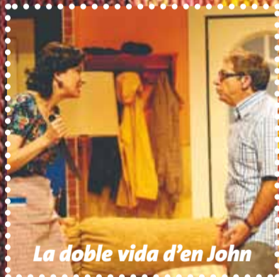
La doble vida d'en John

EL TEATRE AUDITORI DE GRANOLLERS CONJUNTAMENT AMB EL TEATRE DE PONENT HAN ORGANITZAT TRES ESPECTACLES TEATRALS, UN MUSICAL I UN ESPECTACLE DE MÀGIA, A PART DE LA TRADICIONAL SARSUELA I ELS DOS CONCERTS DE MÚSICA DE CAMBRA DE FESTA MAJOR. LES ACTUACIONS TINDRAN LLOC ENTRE ELS DIES 24 I 29 D'AGOST.