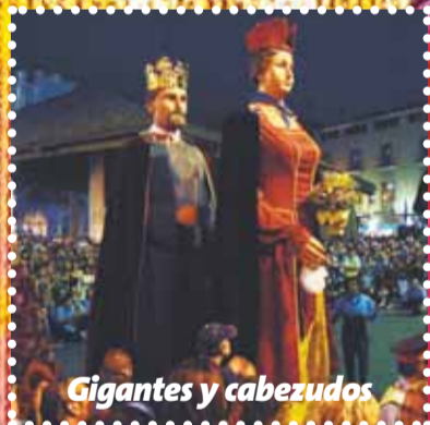
Gigantes y cabezudos