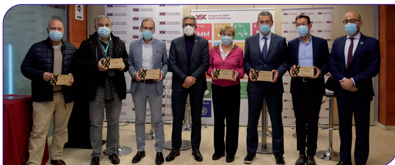
Foto de família dels representants dels hospitals guardonats