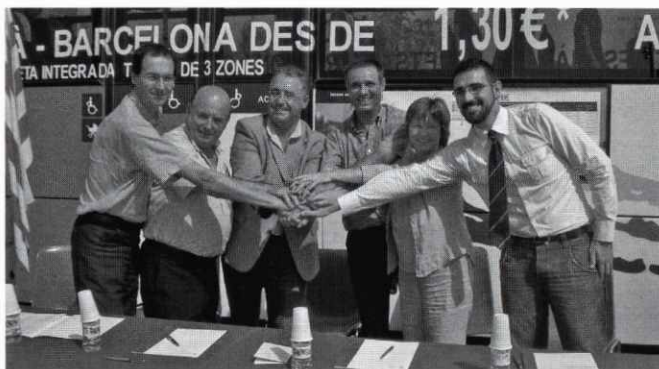
Acte de signatura de la sol·licitud del "Bus Express".