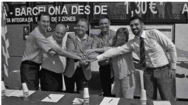
Acte de signatura de la sol·licitud del "Bus Express".