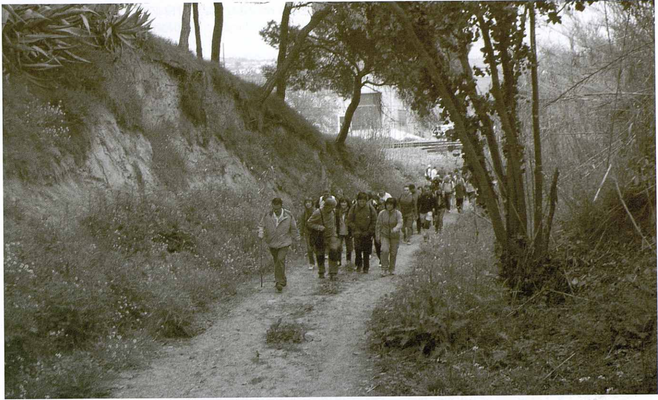
L'excursió al seu pas pel camí de l'Escanyat

que juntament amb les infraestructures associades donen lloc a un efecte barrera que pot portar-nos a l'ofegament.