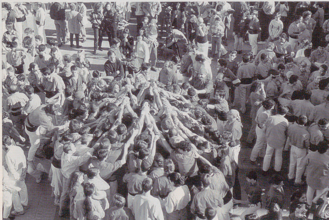
Pinya del 3 de 7 de la Diada de la Colla. Com es pot comprovar, es poden veure clarament les rengles de mans ben formades darrera del baix, els mà i mà i els laterals per impedir que el castell es mogui, com hem comentat anteriorment.