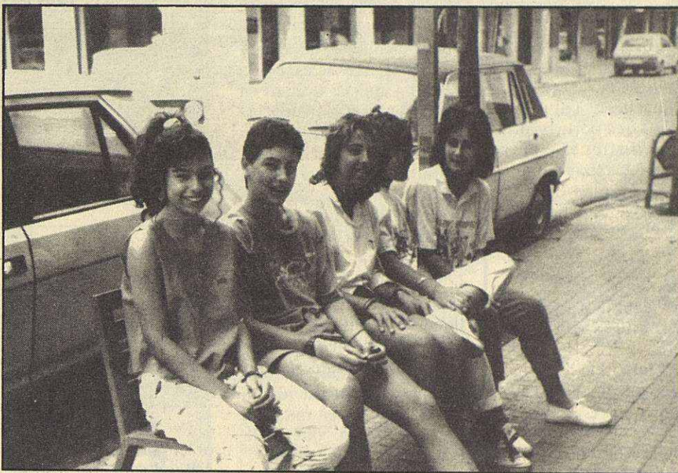
Los jóvenes de hoy, los adultos de mañana. ¡Continuar así!

Elles lliguen nois, ells lliguen noies, però el que tenen més difícil és «lligar» un treball que els proporcionï més independència, estabilitat i seguretat.