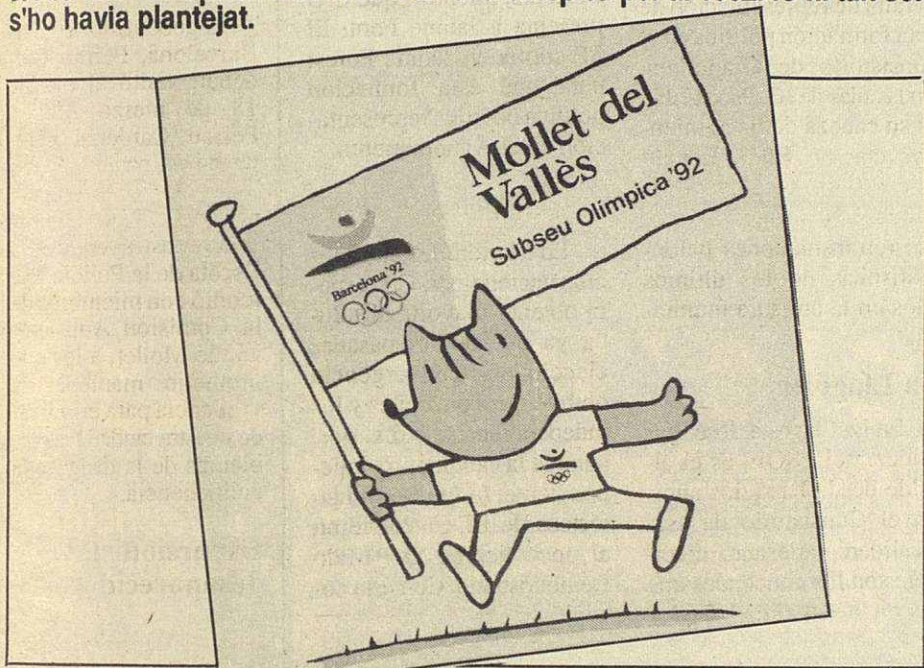
Mollet és Sub-seu olímpica. Disfrutem-ne tots dels Jocs Olímpics.

La sentència referida a les gestions fetes per l'actual Ajuntament afirma: "...L'Ajuntament ha complert en tot moment amb les seves obligacions i en els terminis pactats". Ho diuen els jutges, no nosaltres.