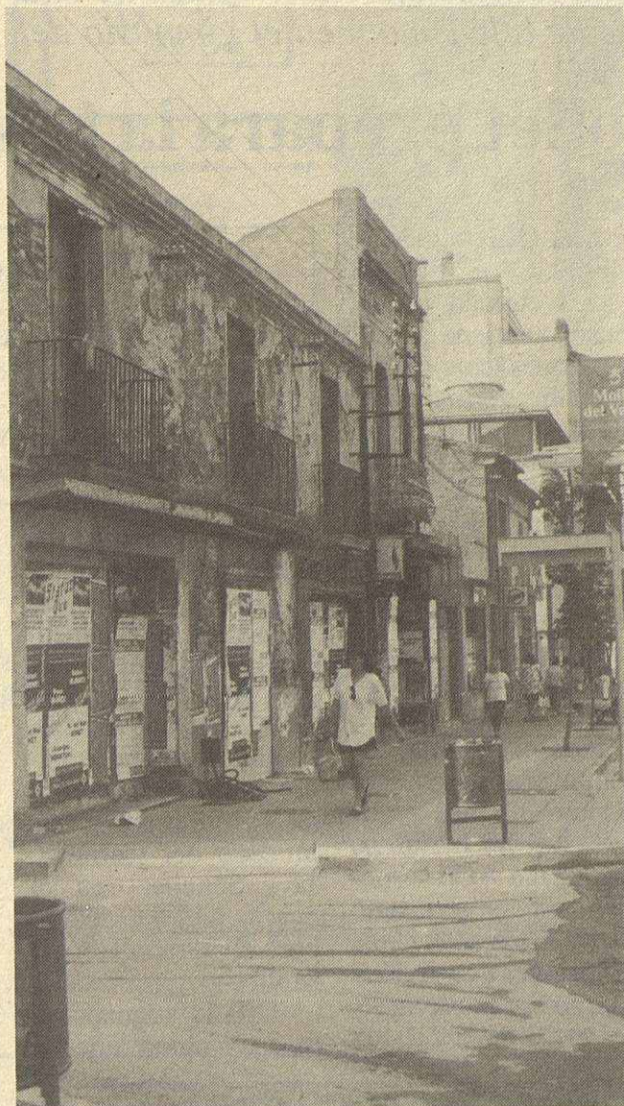
No vendría mal una campaña "Mollet posat guapa".

El pasado día 10 de julio, se inauguró la nueva avenida de Jaime I. Sin duda es una gran noticia que la carretera nacional haya pasado, por fin, a la historia. Pero ya que las