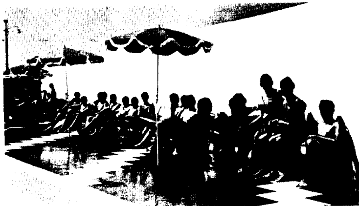
Como se puede apreciar fácilmente, la estancia fue de lo más cómodo.