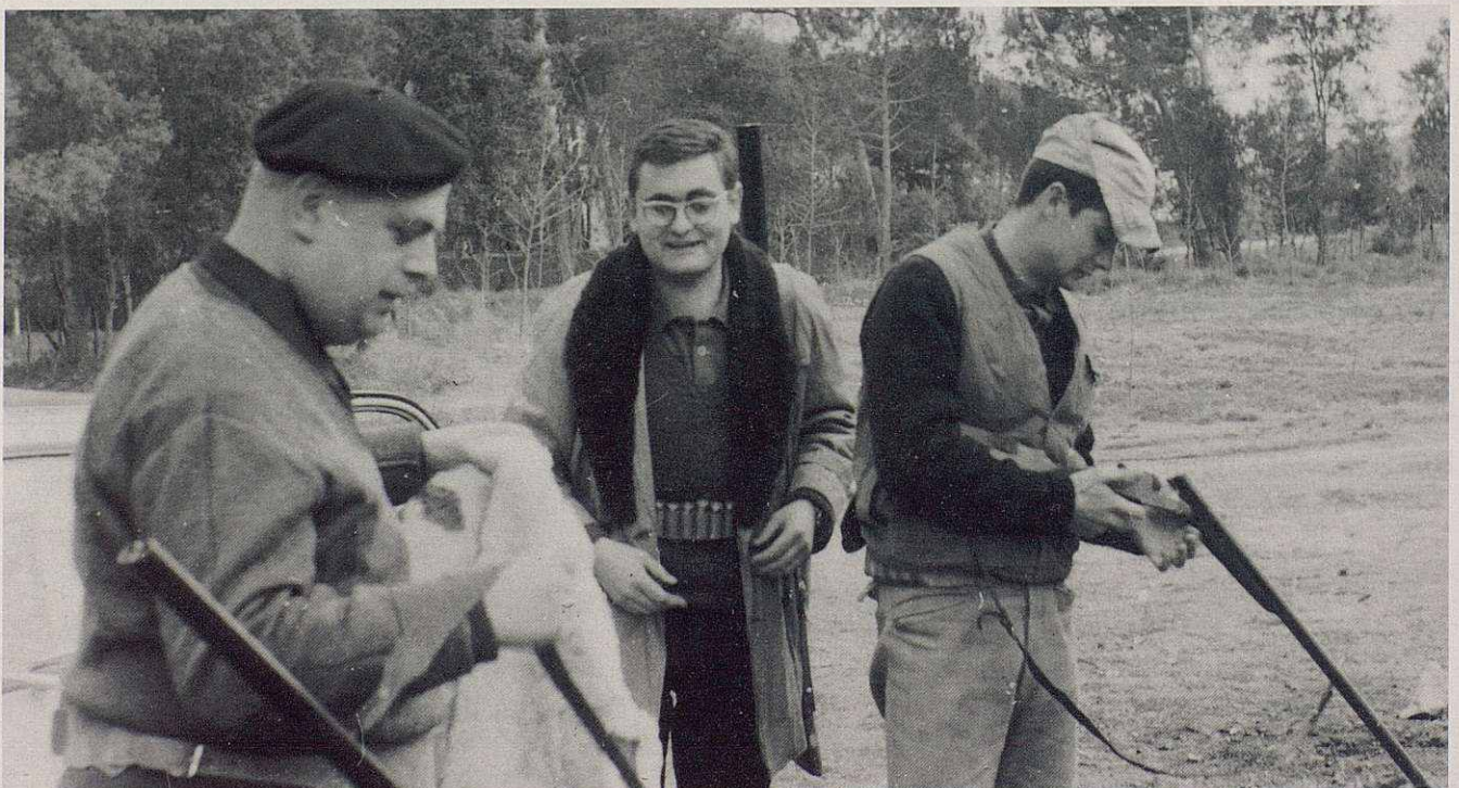
Caçadors de Barcelona, als anys 50, preparant-se per caçar al terreny lliure de Santa Eulàlia de Ronçana.

Més tard, van començar a sortir els vedats i acotats o "cotos". Eren espais de diferent reglamentació, amb una exigència comuna: la impossibilitat de practicar el nostre esport, per part de cap persona que no fos sòcia. Per protegir-se de quedar sense terreny on poder anar a caçar, ja que aquests tipus de terrenys restringits eren regentats per gent adinerada, les diferents societats de caçadors locals van començar a acotar els termes municipals, d'acord amb els propietaris de les finques, constituint els anomenats "Cotos municipals". Encara, però, quedaven zones lliures en totes les províncies, on anar a fer alguna excursió cinegètica i poder assolir bons resultats.