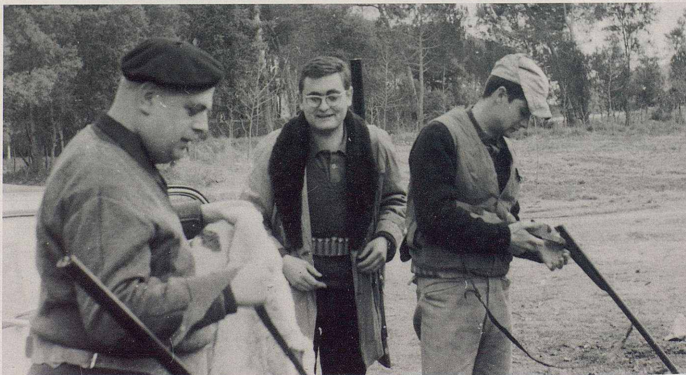
Caçadors de Barcelona, als anys 50, preparant-se per caçar al terreny lliure de Santa Eulàlia de Ronçana.

Més tard, van començar a sortir els vedats i acotats o "cotos". Eren espais de diferent reglamentació, amb una exigència comuna: la impossibilitat de practicar el nostre esport, per part de cap persona que no fos sòcia. Per protegir-se de quedar sense terreny on poder anar a caçar, ja que aquests tipus de terrenys restringits eren regentats per gent adinerada, les diferents societats de caçadors locals van començar a acotar els termes municipals, d'acord amb els propietaris de les finques, constituint els anomenats "Cotos municipals". Encara, però, quedaven zones lliures en totes les províncies, on anar a fer alguna excursió cinegètica i poder assolir bons resultats.