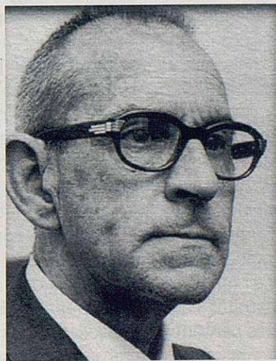
Salvador Espriu i Castelló

– Ja sabeu que els qui figuren com a governants de les nacions les dominen com si en fossin amos, i que els grans personatges les mantenen sota el seu poder. Però entre vosaltres no ha de ser pas així: qui vulgui ser important enmig vostre, que es faci el vostre servidor, i qui vulgui ser el primer, que es faci l'esclau de tots; com el Fill de l'home, que no ha vingut a ser servit, sinó a servir i a donar la seva vida com a rescat per tothom (Marc 10, 42-45).