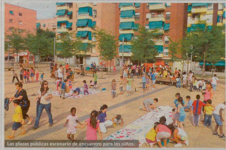
Las plazas públicas escenario de encuentro para los niños.