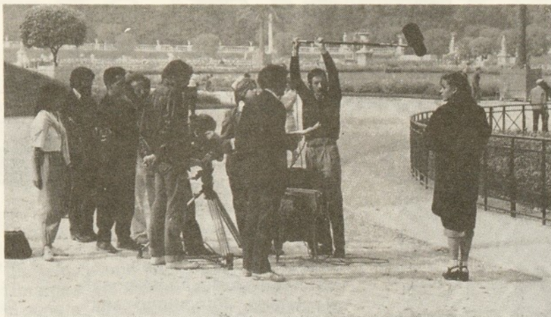
Rodatge d'un clip literari realitzat per Télél liberation