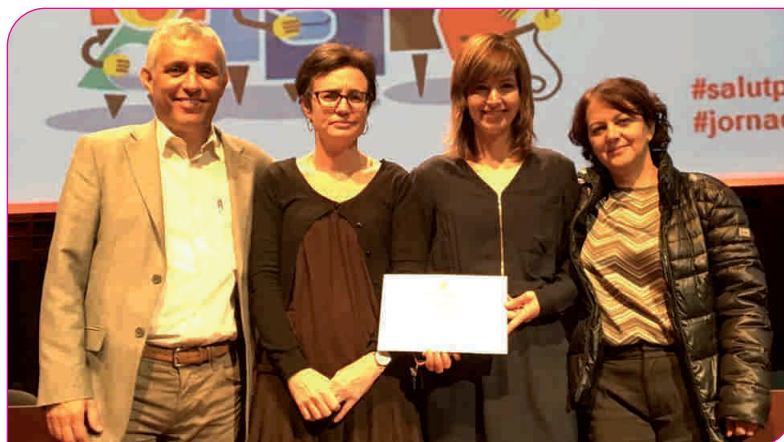
Els representants del programa We love eating, amb el guardó

El We love eating és un programa europeu desenvolupat per professionals de l'Hospital General de Granollers, l'Ajuntament i l'Institut Català de la Salut durant els anys 2014 i 2015 a Granollers conjuntament amb 6 ciutats més de diferents països, que té l'objectiu de promoure estils de vida i una