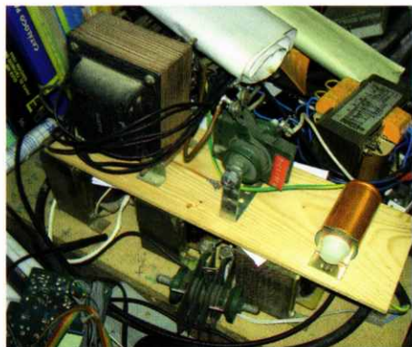
Un rectificador de 12 v i un convertidor de 380 a 220 v.

Hi va haver una època que contínuament tenia feina a fer ràdios. Amb la tele, igual. Amb la televisió em vaig estendre a vendre'n per tot arreu. A més de fabricar-ne per una casa de Barcelona, en vaig vendre molts com a particular. N'hi havia un que es cuidava de buscar-me gent. Granollers, La Garriga, Sant Feliu... a tot arreu. De vegades fins i tot, a Tarragona i Girona.