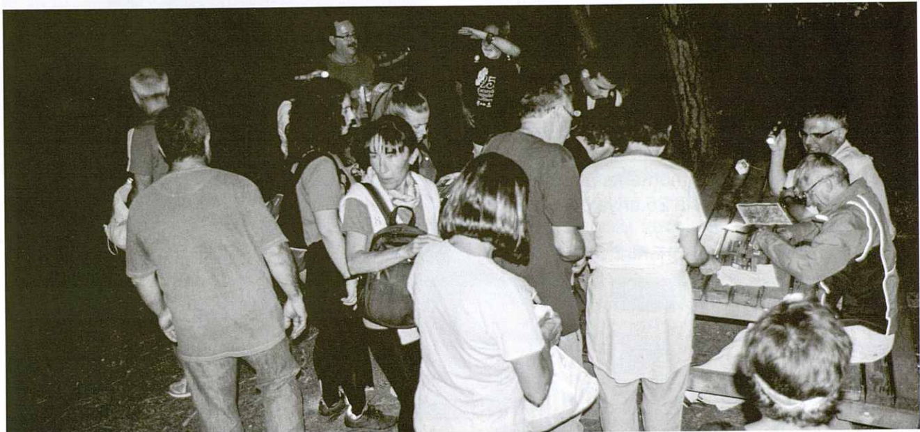
Control a la Font del Ràdium.