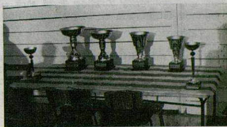
Trofeos en litigio en el I TORNEO DE MONTORNÉS.