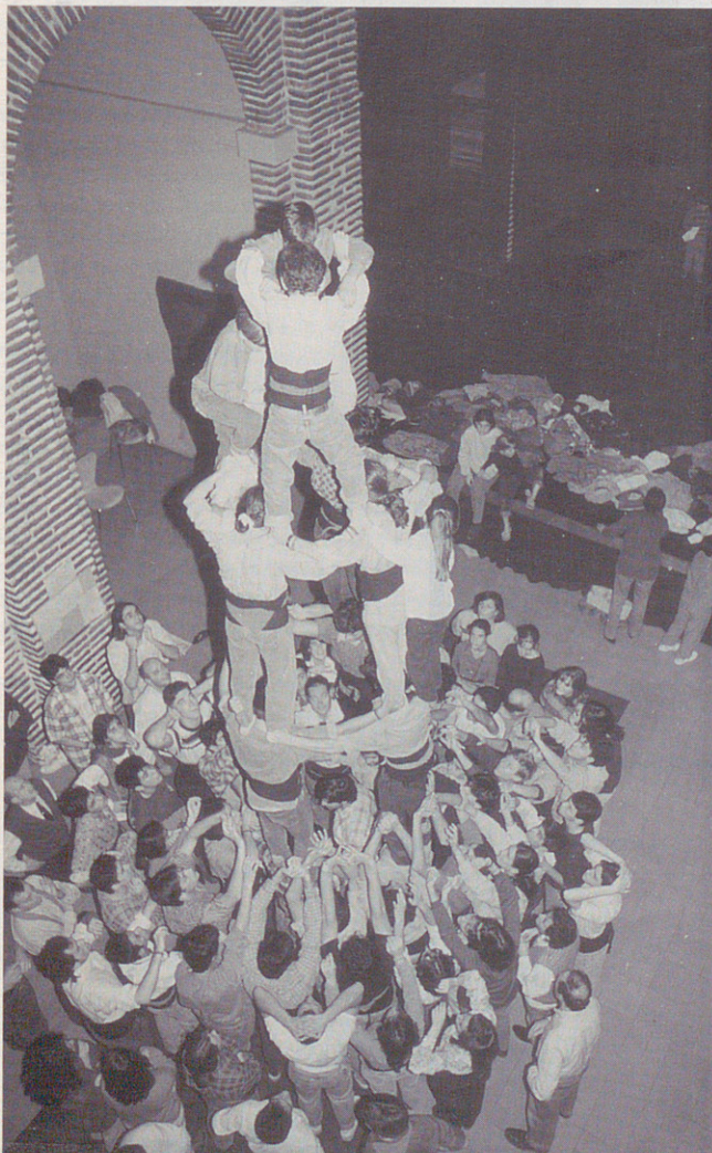
Pinya en una prova del 4 de 7 amb agulla d'un assaig abans de la Diada. També cal fer pinya en els castells nets per prevenir possibles caigudes innecessàries.

Per tal de tancar els forats que deixen les crosses als costats dels baixos hi posem la figura dels daus que ajuden els baixos i tapen el forat que hi ha entre els baixos.