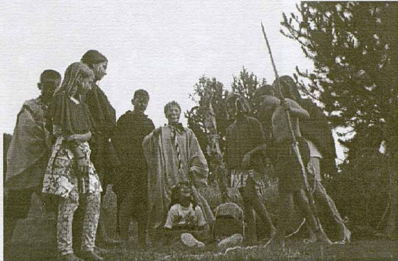
El grup dels mitjans es convertiren en una tribu indígena.

va convertir en una tribu indígena que havia sobreviscut amagada de la civilització en el mateix terreny on nosaltres érem acampats. Van fer un sacrifici davant del tòtem. El grup de petits es va fer amic d'aquesta tribu i els hi van mostrar el sistema de vida actual.