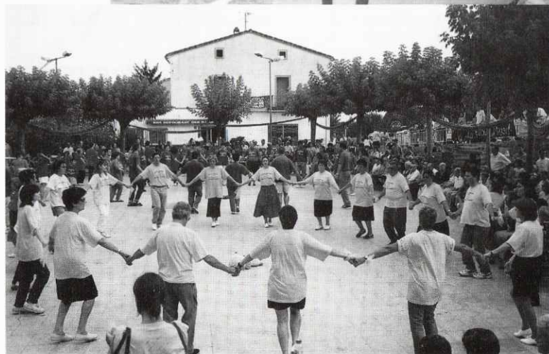
Els grocs tot ballant la Sardana.