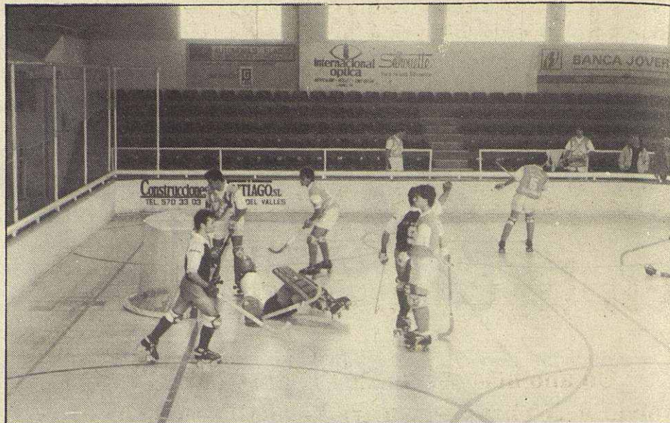
La afición, ausente en los partidos del C. P. Mollet

te de la entidad un reducido número de personas que están haciendo todo lo posible para intentar sacar a la entidad del pozo en el que se encuentra pero, este esfuerzo, posiblemente no sea suficiente. El C.P. Mollet también ha atravesado crisis a lo largo de sus casi cuarenta años de historia y siempre ha conseguido salirse de ella. Pero, en esta ocasión está faltando algo importantísimo: querer salir de la crisis. Ha llegado el momento de olvidarse de las rencillas personales y de intentar que-