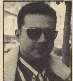
J. Antonio Pérez Arts Gràfiques

"Sí, i tant que sí, jo compraria productes espanyols per tal d'ajudar a sortir de la crisi. A l'hora de triar, pel mateix preu, em decanto pels productes d'aquí".