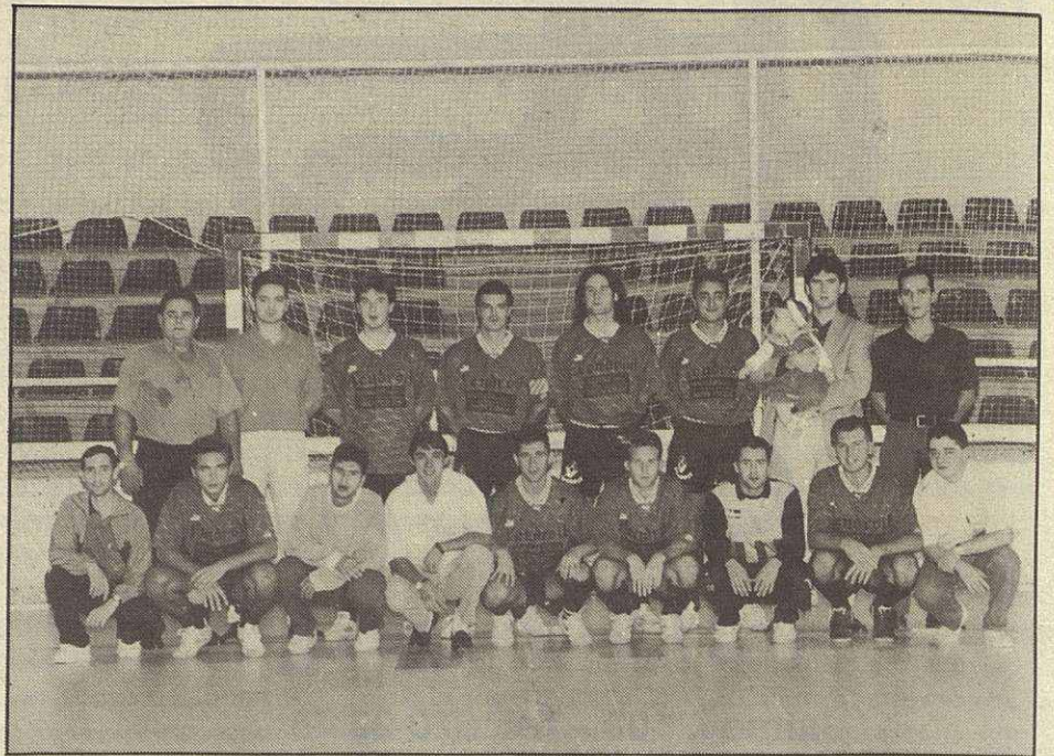
Plantilla de Endroit Movirsa de la presente temporada

Este equipo de fútbol sala consiguió el ascenso este tempora-