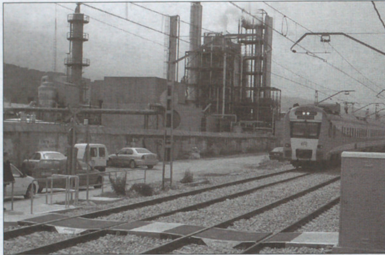
Los pasos a nivel desprotegidos constituyen un peligro para los vecinos de Sant Celoni.

En relación al calendario de actuaciones de dicho acuerdo, según lo determinado, los pasos a nivel serán suprimidos dentro de su período de vigencia que en principio se establece en seis años. En concreto en relación al