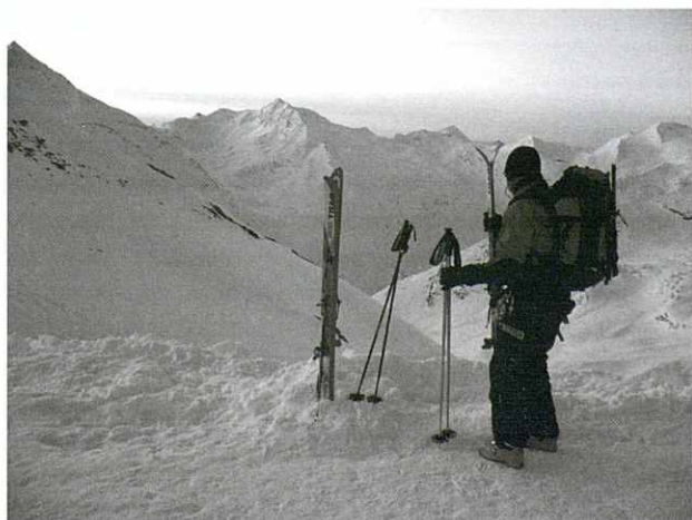
Tot mirant la sortida del sol des de la cabana Britanniahütte.

A la sortida agafem altre cop direcció est, igual que el dia anterior, per arribar fins al coll Alphubeljoch (3.772 m.). Com que fa un esplèndid dia, no parem de sentir helicòpters que van i venen del coll, deixen esquiadors que fan el descens fins a Täsch. Una vegada hem arribat al coll, (amb el nostre esforç, clar!!), intentem no perdre gaire alçada franquejant direcció nord-oest per arribar al peu del cim Alphubel. Al tram final agafem direcció oest, és quan ens trobem amb una forta pendent amb grans cerats i esquerdes que fan una pujada molt tècnica, però que ens permet arribar al cim amb esquis. A dalt contemplem una espectacular vista. Ara ens toca el descens fins al refugi Längfluehütte, el primer tram desfem l'última pujada de la forta pendent, anant molt en compte amb les esquerdes i els cerats.