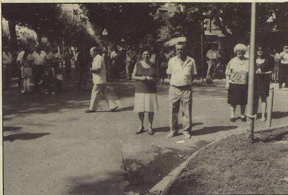
Los ciudadanos molletenses han sido claros sobre la independencia de Catalunya