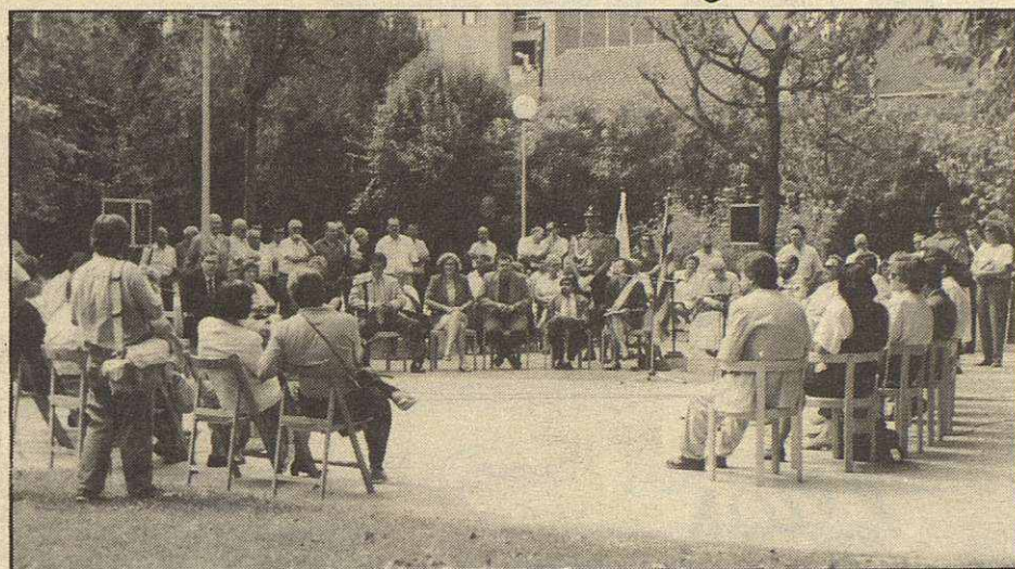
El Ayuntamiento de Mollet celebró el pasado sábado, día 11, coincidiendo con la Diada Nacional de Catalunya, un pleno de marcado carácter conmemorativo, reuniéndose alrededor del roble del Milenario, queriendo recordar así las reuniones que mantenían hace 500 años los máximos dirigentes de Mollet, Gallecs y Parets. La tradicional ofrenda floral al monumento de Rafael de Casanovas fue otro de los actos de la Diada