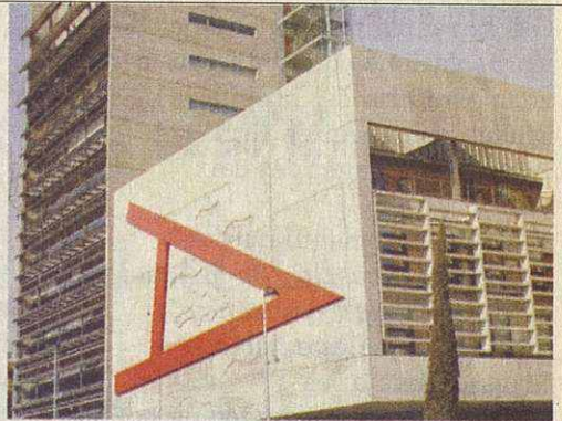
La polémica ha estado presente en el ayuntamiento

Los puntos más calientes de la política local durante los últimos meses han sido el tema de los asesores y l'Entesa. La polémica del caso "Baño" ha ocasionado cambios en la política llevada a cabo sobre los asesores de alcaldía. A partir de ahora, el alcalde prescindirá del asesor de alcaldía que colaboraba con el