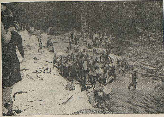
La rialla unànime dels adolescents «rentadors» a l'espera d'una cigarreta rossa és un espectacle ple de simpatia i delit de viure. Costa d'Ivori - 1974