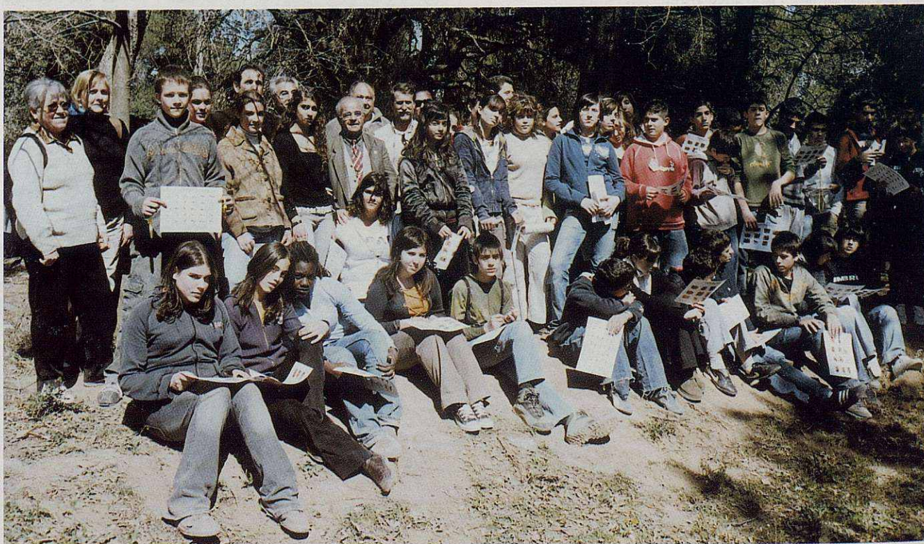
L'alcalde i el president de la Societat de Caçadors de Santa Eulàlia de Ronçana, amb directius de la Federació Catalana de Caça, el cap d'Activitats Cinegètiques de Medi Ambient, el cap dels Agents Rurals del Vallés Oriental i els professors i alumnes d'ESO, participant en la repoblació de perdius, conills i faisans, lliurats als terrenys de la part alta de Santa Eulàlia, el març del 2007.

Jo diria: que aquesta "espècie", hauria d'estar també relacionada en el llibre vermell, d'espècies en perill d'extinció. Sort tenim, encara que, en aquest lent descens del nombre d'afeccionats van apareixent noves incorporacions femenines, que seguint el procés normal de "desmasclitació" que hi ha arreu, també passa en el món de la caça. Benvingudes siguin aquestes novelles caçadores al col·lectiu quasi "d'avis caçadors".