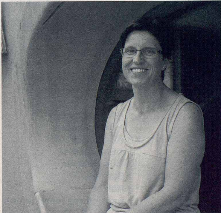
Aquesta educadora coneix pedagogies innovadores com la d'Emmi Pikler, Waldorf, Reggio Emilia i Louis Malaputzi.

Poques, perquè per estar tot el dia amb nens has de ser jove. És molt cansat, et xuclen energia! Jo sempre dic a les companyes que han de tenir "acti-