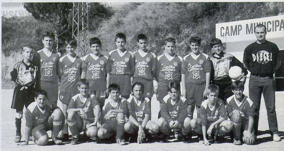
Conjunt Infantil de l'O. la Garriga