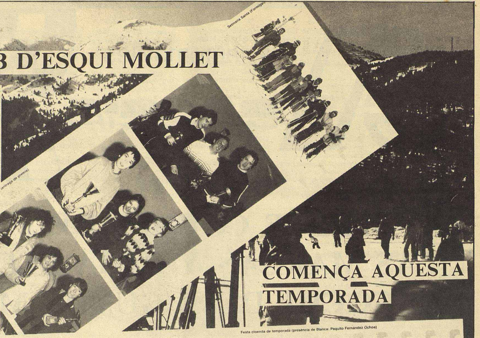
Semana Santa (Formigal)

Cal destacar fins ara l'interès dels aficionats a l'esquí que han omplert l'autocar en cadascuna de les sortides, així com el bon esperit que en totes elles s'ha donat, amb joventut i bon humor per superar les dificultats de la ruta i les vicissituds de les curses, resoltes totes elles afortunadament fins ara sense incidents ni menys accidents dignes de menció.