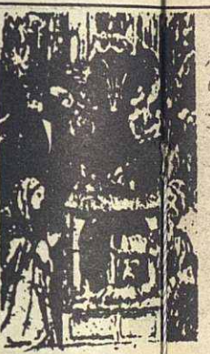
«NAVIDAD» Detalle del retablo de la catedral de Sevilla, realizado en estilo gótico por el maestro flamenco Perceval Dancart Savin a fines del siglo XV.

El proper dia 5 de novembre es celebrarà una conferència-col·loqui organitzada per la Cambra de Comerç, la Federació de Comerç i serveis i l'Ajuntament de Mollet.